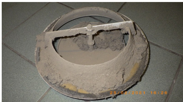
Enne A ja B-korpus