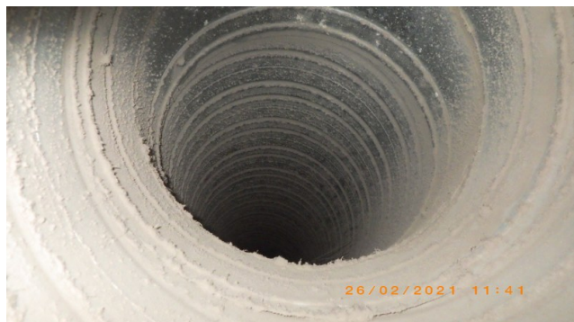
Enne A ja B-korpus