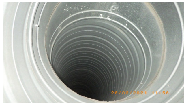
Pärast A ja B-korpus