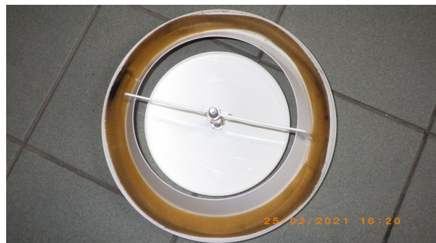
Pärast A ja B-korpus