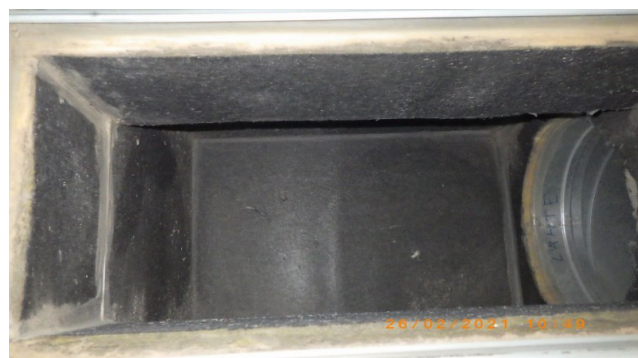
Pärast A ja B-korpus