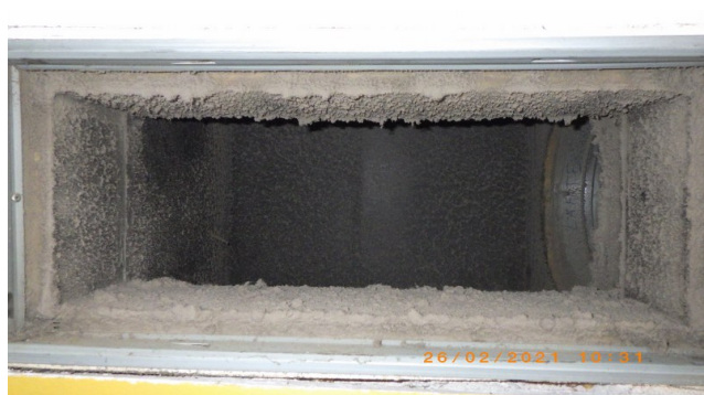
Enne A ja B-korpus