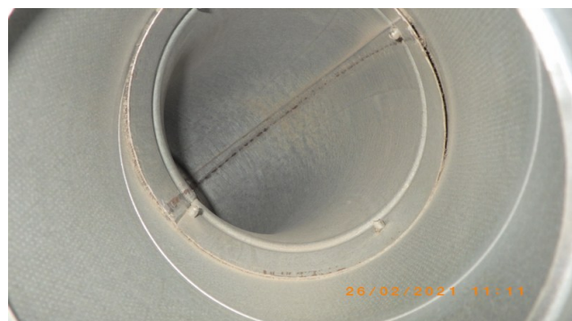
Pärast A ja B-korpus