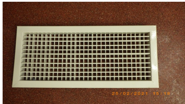
Pärast A ja B-korpus