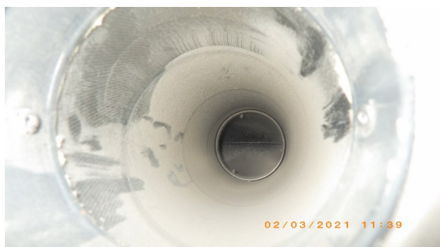
Enne A ja B-korpus