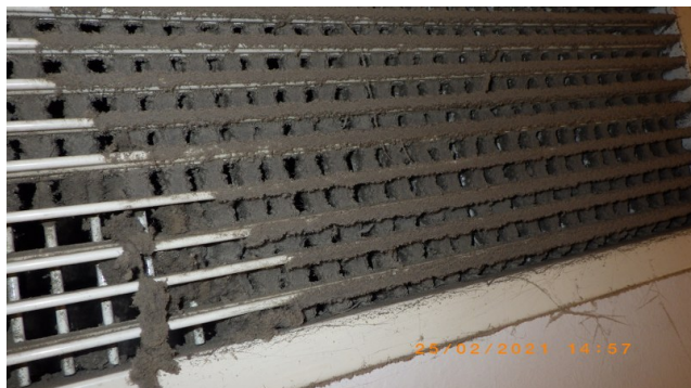
Enne A ja B-korpus