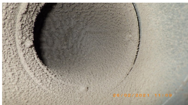
Enne A ja B-korpus